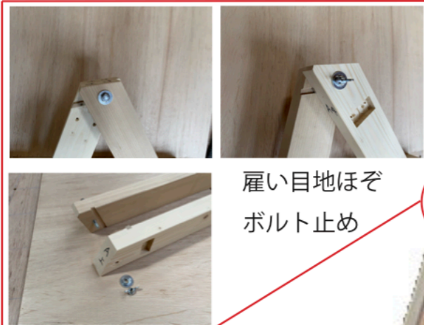
雇い目地ほぞ ボルト止め