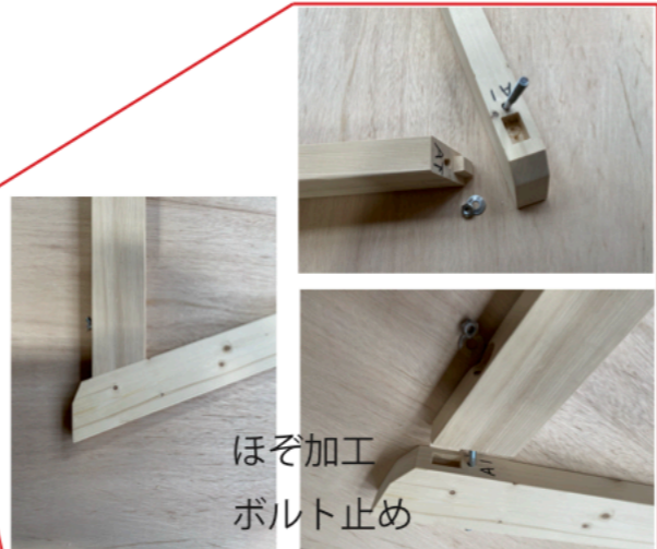
ほぞ加工 ボルト止め