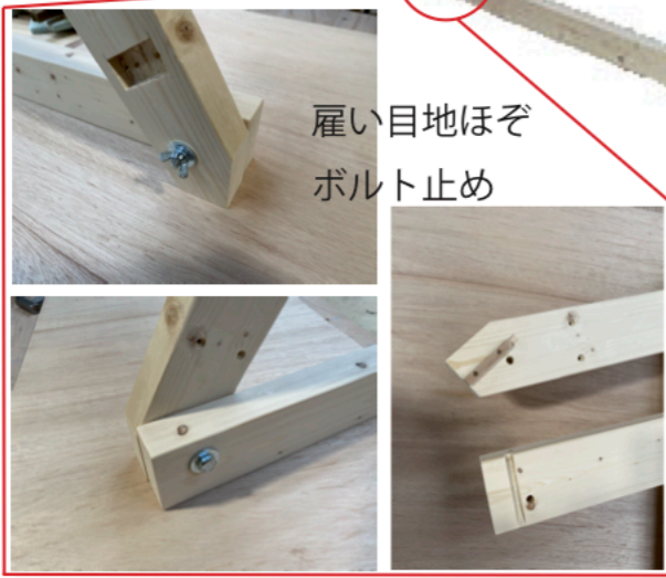
雇い目地ほぞ ボルト止め