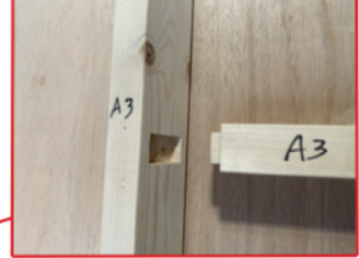
ほぞ加工 ビス止め