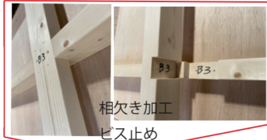
相欠き加工 ビス止め